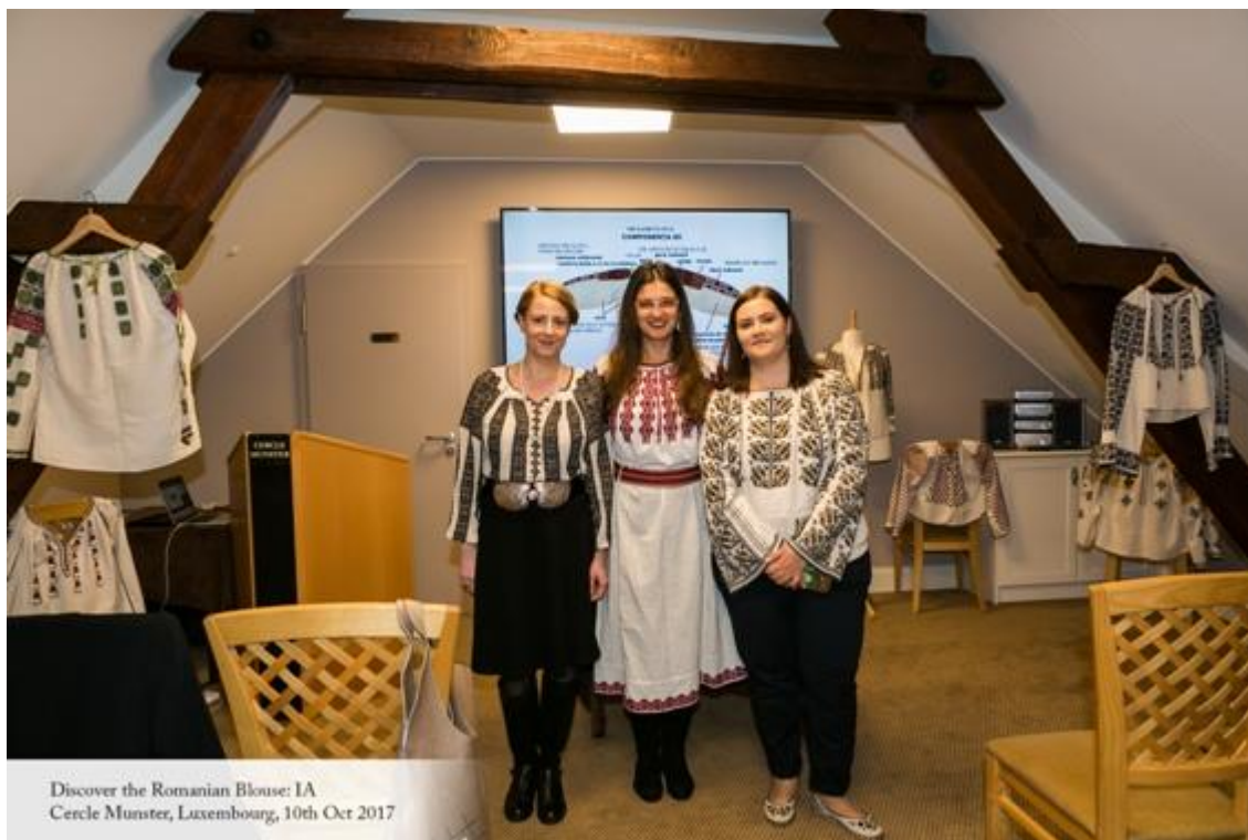
Discover the Romanian Blouse: IA Cercle Munster, Luxembourg, 10th Oct 2017

Următoarea conferință de prezentare a iei românești va avea loc în Luxemburg în data de 13 februarie 2018.